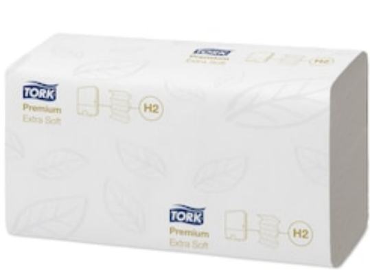
TorkXpress Toalha Interfolha Extra suave 100297