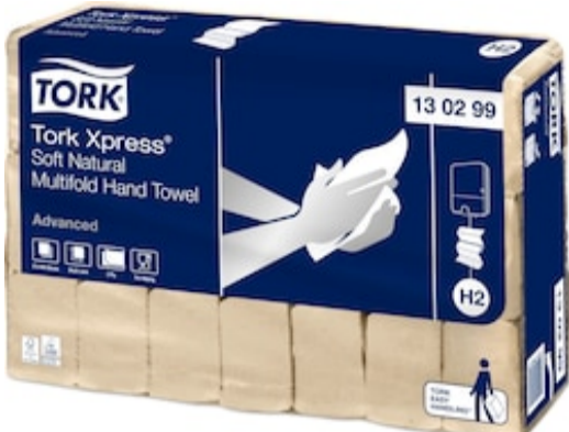
Tork Xpress Soft Multif Nat HT Adv 2p Z 130299