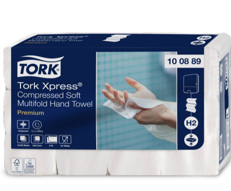
Tork Xpress Comp Soft MF HT Prem 2p Z 100889