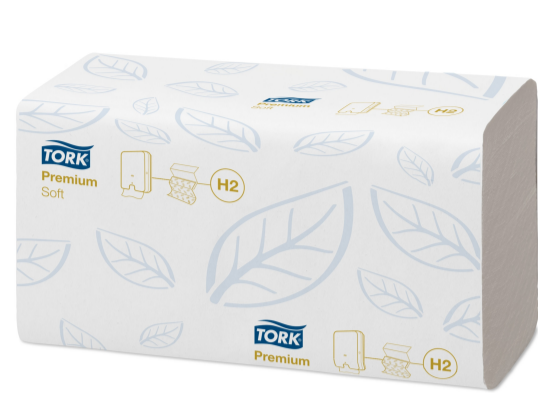
Tork Xpress Soft Multifold HT Prem 2p Z 100289