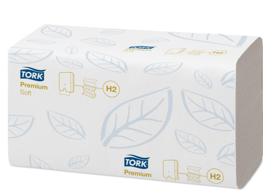
Tork Xpress Soft Multifold HT Prem 2p Z 100289