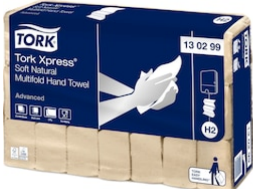
Tork Xpress Soft Multif Nat HT Adv 2p Z 130299