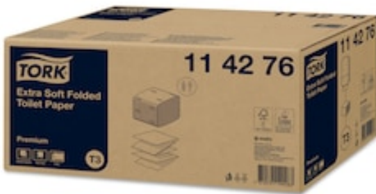
Tork Papel Hig.Folha a Folha Extra suave 114276