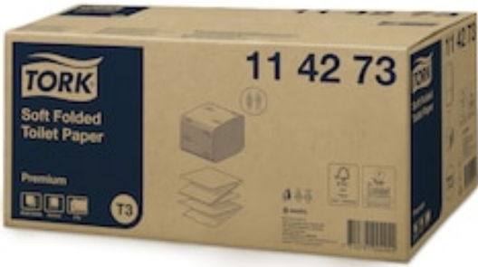
Tork Folded Toilet Paper Prem 2p 252s 114273